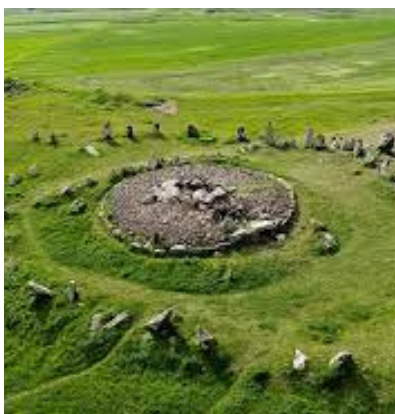
Зорац карер или Караундж