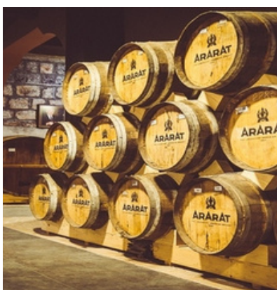
Армянский коньячный завод