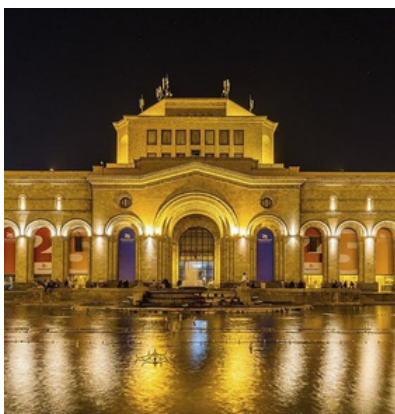
Музей истории Армении