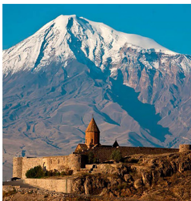
Монастырь Хор- Вирап